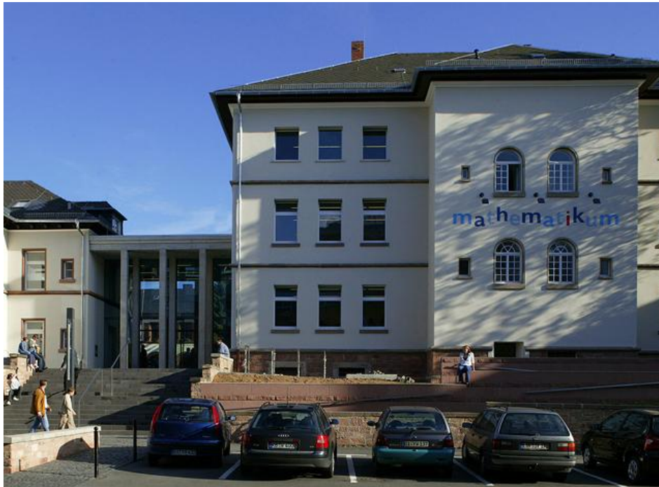
Mathematikum Giessen